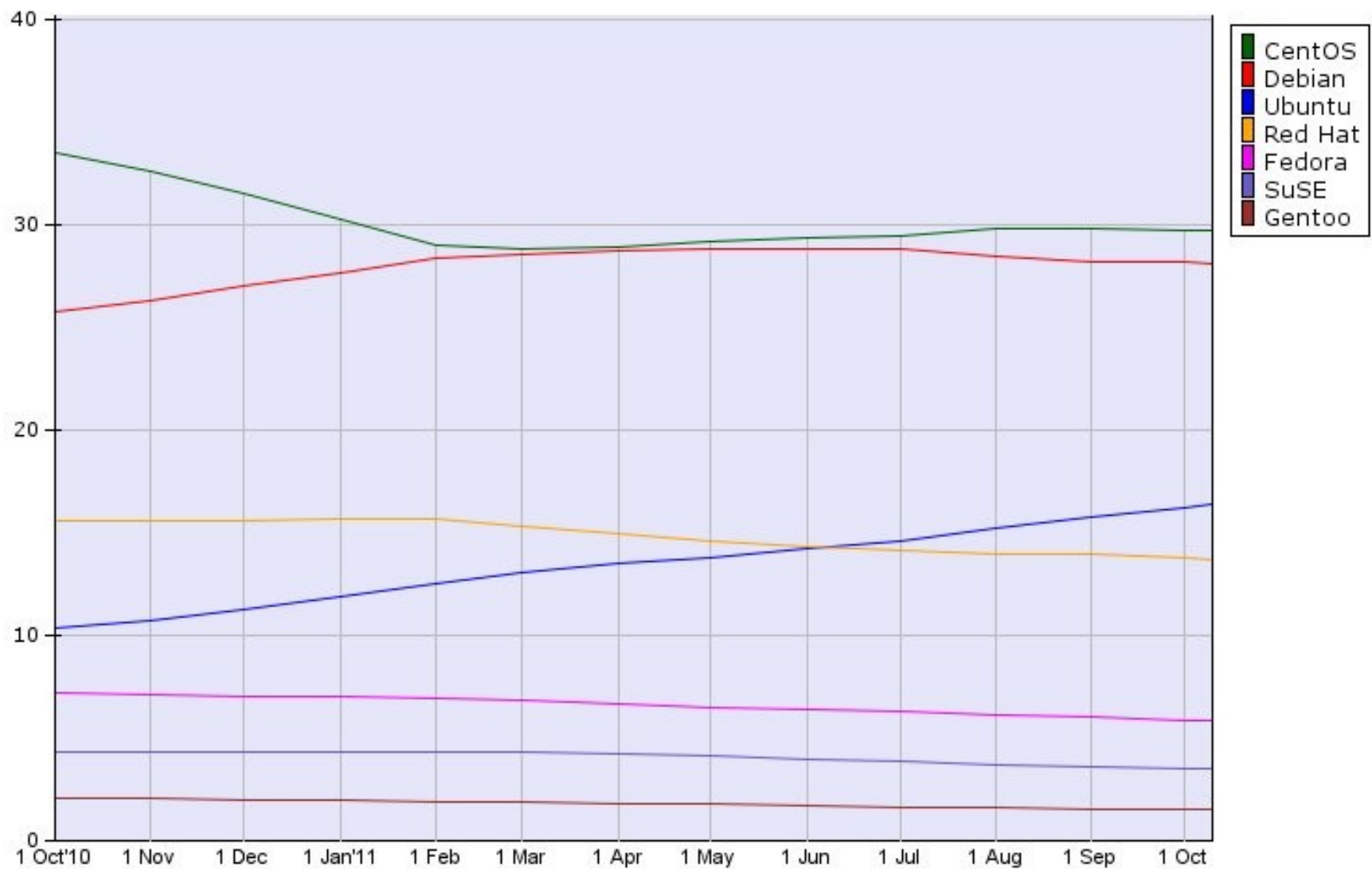
Usage of Linux for websites, 10 Oct 2011, W3Techs.com